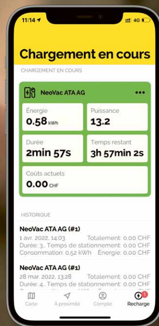
« NeoVac myCharge » dans le détail : neovac.ch/mycharge

Offrez à vos clients et clientes et aux habitants la possibilité d'activer, de stopper et de payer les recharges sur votre réseau directement via un smartphone. « NeoVac myCharge » leur permet de trouver pour leurs véhicules électriques des bornes de recharge publiques reliées au réseau partenaire ou NeoVac ou des réseaux privés également compatibles.